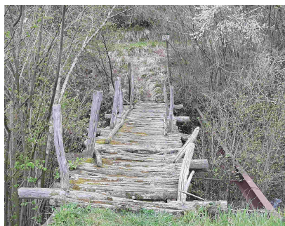
Passerella sul Fiumicino

L'escursione inizia su strada bianca in ripida discesa e si raggiungono in breve i ruderi di Ca Brensica e il fosso Fiumicino che si attraversa su una passerella.