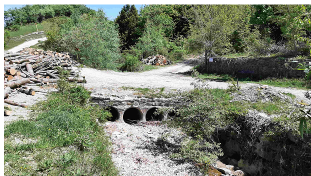
Taglio della Regina

L'origine del nome è incerta, secondo la tradizione popolare il "Taglio" sarebbe stato fatto fare da una regina che in tempi antichissimi regnava su quei luoghi.